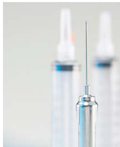
Bild 5 Die Impfung gegen FSME bietet sehr guten Schutz.