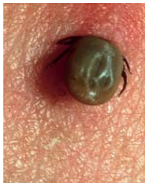
Bild 4 Zecke entfernen: Zecke direkt über der Haut mit Pinzette oder spezieller Zeckenzange fassen und senkrecht zur Hautoberfläche herausziehen. Stichstelle desinfizieren.