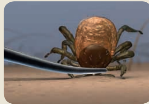
En retirant correctement et rapidement la tique, le risque de transmission de la borréliose de Lyme peut être diminué.