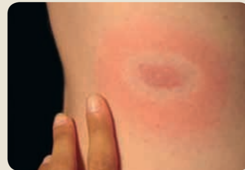
Symptôme typique de la borréliose de Lyme : érythème migrant autour du point de piqûre.

Chaque année en Suisse, entre 6000 et 12000 personnes contractent une borréliose de Lyme. Le risque de transmission de la maladie est déjà présent moins de 24 heures après une morsure de tique. Le premier signe de la maladie est fréquemment une rougeur cutanée localisée, ou érythème migrant, qui apparaît souvent quelques jours seulement après la morsure – généralement en l'espace de 3 semaines – et qui s'étend progressivement autour du point de piqûre sous forme de tache ou d'auréole.