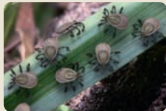
Larve à six pattes Taille : env. 0.5 mm

Le développement des tiques se déroule en trois étapes, de l'état de larve à la taille adulte en passant par la nymphe. La transition d'un stade à l'autre requiert un repas sanguin. Des agents pathogènes peuvent être transmis à l'hôte par le biais de la piqûre d'une tique. Selon leur stade de développement, les tiques sont de taille différente et leur couleur varie. Les nymphes, bien que relativement petites et difficilement visibles, représentent déjà un grand danger : en effet, elles peuvent être porteuses de bien plus d'agents pathogènes que les tiques adultes.