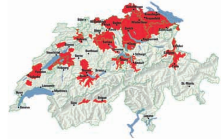
■ OFSP – MEVE – vaccination recommandée

L'Office fédéral de la santé publique recommande à toutes les personnes adultes ainsi qu'aux enfants à partir de 6 ans de se faire vacciner préventivement dès lors qu'ils vivent dans des zones endémiques ou y séjournent temporairement.