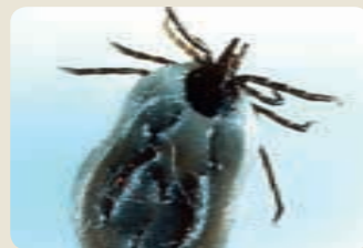
Tique gorgée de sang Taille : env. 7-8 mm